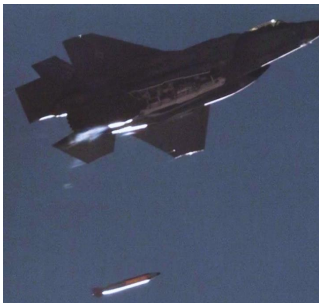
Figura 2 – Uma bomba inerte B61-12 para ensaios, largada de um F-35A