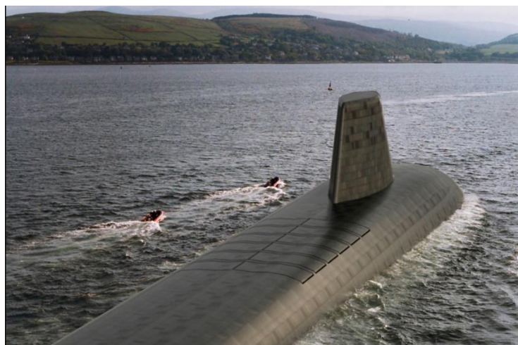
Figura 4 – Uma impressão artística da futura classe HMS Dreadnought