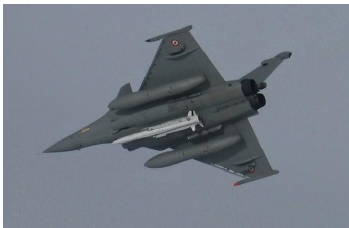
Figura 3 – Um míssil inerte ASMP-A para ensaios, montado num Rafale

terrestres, quer embarcados. Entre as modificações, encontra-se a inclusão de uma nova carga militar termonuclear, de “média energia”, estando planeada uma futura nova arma, designada por ASN4G 22 .